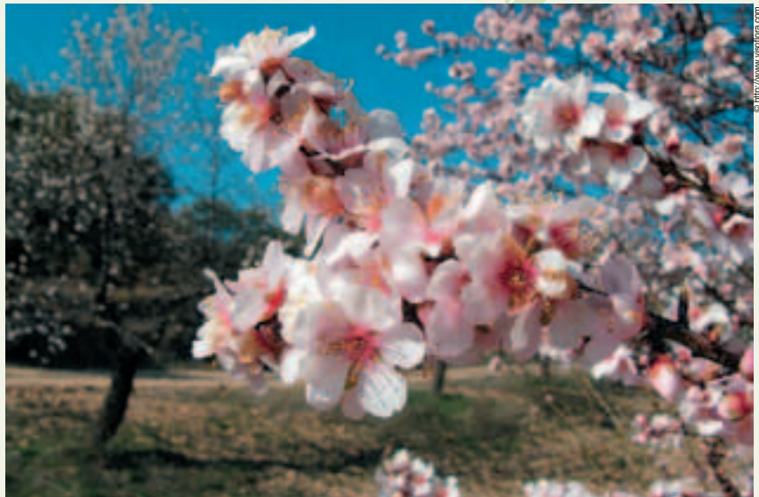
Figure 1 : branche d'amandier en fleur.

D'une longueur comprise entre 6 et 10 cm, elles se développent après la floraison.