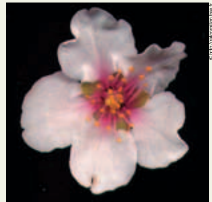
Figure 2 : vue de détail d'une fleur d'amandier.

Le fruit est une drupe oblongue de 3 à 5 cm de long, à épicarpe