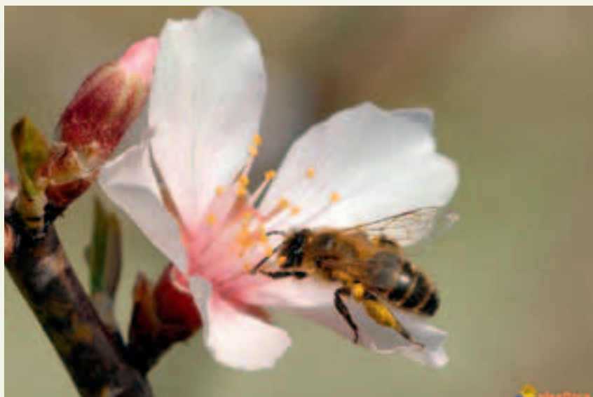
Figure 4 : abeille butinant une fleur d'amandier.

Enseignant en biologie végétale à l'Université Pierre-et-Marie-Curie