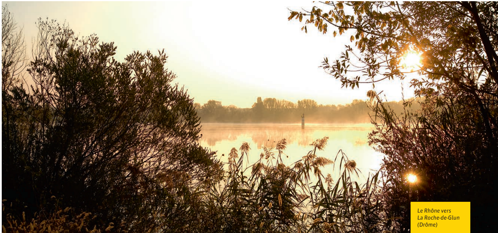
Le Rhône vers La Roche-de-Glun (Drôme)