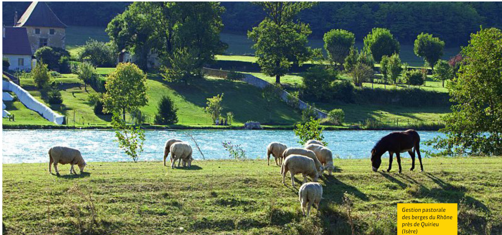
Gestion pastorale des berges du Rhône près de Quirieu (Isère)