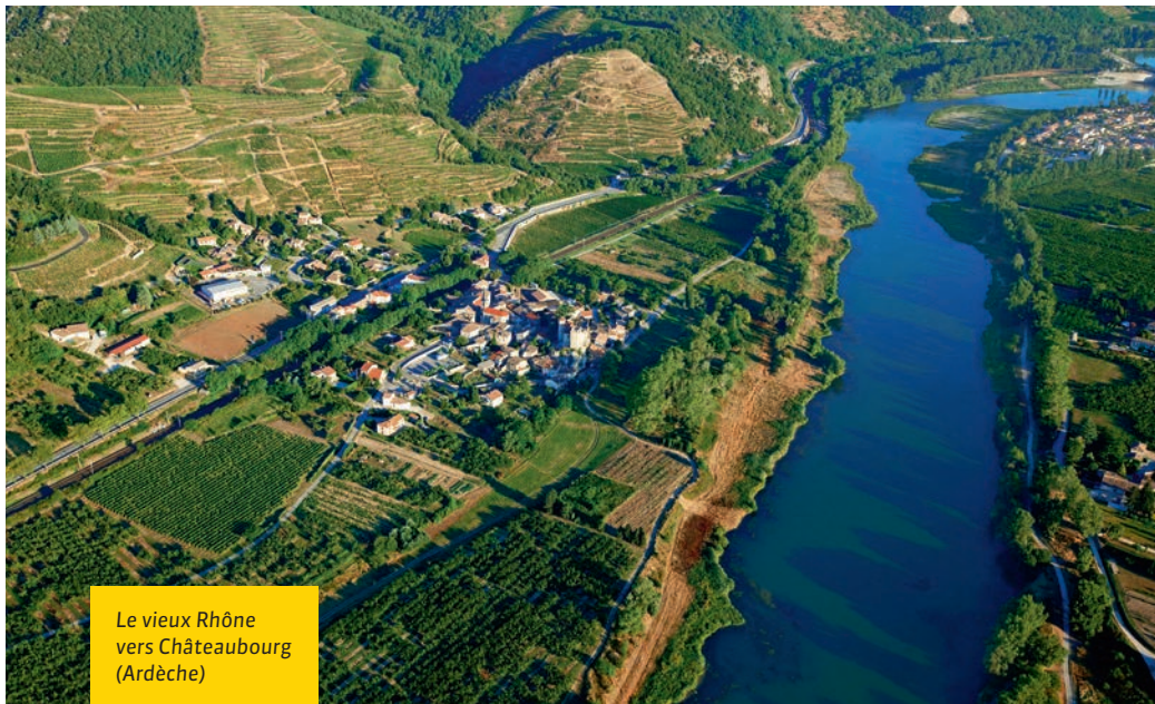
Le vieux Rhône vers Châteaubourg (Ardèche)