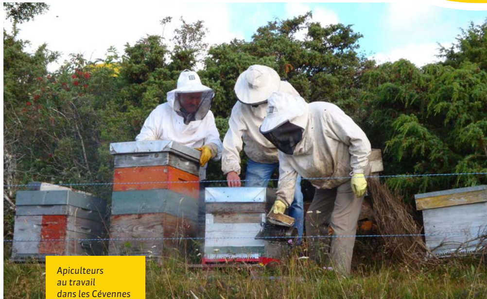
Apiculteurs au travail dans les Cévennes