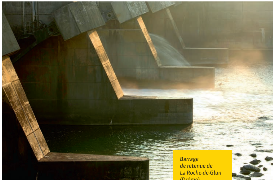
Barrage de retenue de La Roche-de-Glun (Drôme)

La CNR poursuivra notamment dans le cadre de son 3 e Plan 2014-2018 sa démarche en faveur de la qualité de l'eau et de la biodiversité. Le programme Abeilles et Compagnie en est l'une des composantes et permet aussi de renforcer la mission historique de la CNR envers le monde agricole.