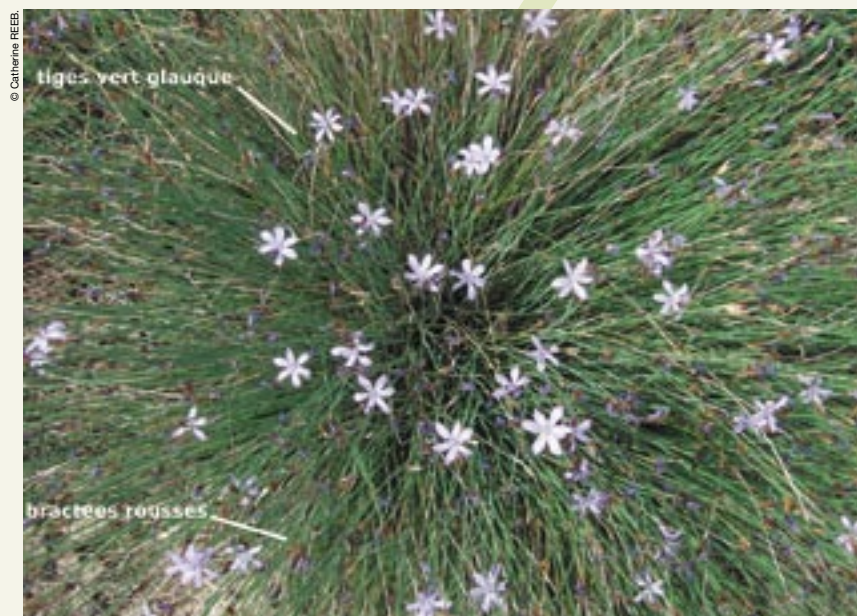
Figure 1 : vue d'ensemble typique d'une touffe d'aphyllanthes de Montpellier.

Elles sont pollinisées par les abeilles et par les diptères, mais sont aussi considérées comme autogames, chaque fleur pouvant être pollinisée avec son propre pollen.