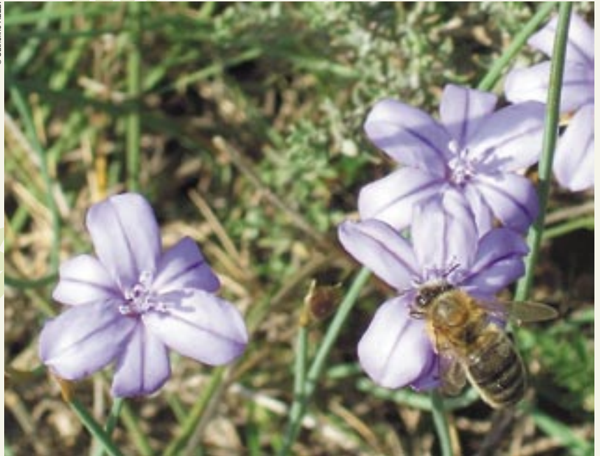
Figure 2 : une abeille sur une aphyllanthes, qui semble puiser avidement du nectar !